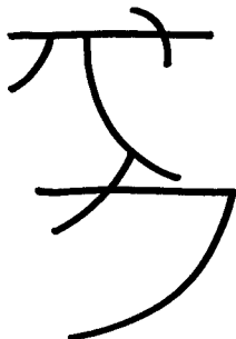
Symbol senz tan

Pro adepta to znamená cestu energie mistra.