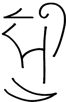
Symbol zen kai džo

Duchovní učitelé říkali: „Žáku! Když se učíš a procházíš zasvěcením, osobně tím napomáháš očistě světa a vesmíru.“ A to je v nadcházejícím věku Vodnáře obzvlášť důležité. Na každého zasvěcence i neofyta působí na všech stupních vzestupu důležitý princip trvalé očisty. Zasvěcený musí jít příkladem a učit ostatní. Pokud adept či mistr nebojuje s nedostatky, netlumí svůj hněv a nevzdává se touhy po pomstě, podporuje tak svou lakotu a hýčká si ego. Takovýto adept není doopravdy očištěný a jeho bílý šat je falešné pozlátko; vždyť jeho myšlenky a slova jsou nečistá.